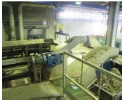
Prensa de residuos