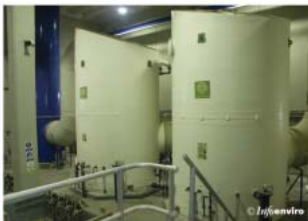
Torres de lavado de la desodorización en tratamiento preliminar

agua entre 0,5 y 0,75 m. Su instalación ha permitido, en primer lugar, aislar dichas salas de las emisiones directas de gases, y en consecuencia reducir las tasas de renovación a valores entre 3 y 4,5 r/h, lo que ha supuesto reducir a prácticamente la mitad el caudal de aire de ventilación.