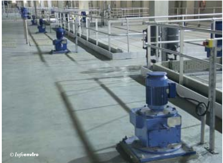
Moto-reductores de la cámara de mezcla y floculación

La concepción y profundidad del decantador permite la concentración necesaria de los fangos, realizando las funciones de un espesador incorporado al decantador. La concentración media de diseño de los fangos espesados, ampliamente lograda en la explotación, es de un 4% sin reactivos y de un 5,5% con reactivos, como límites mínimos.