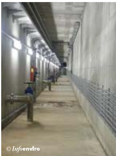
Galería de servicios entre los decantadores y las cámaras de floculación

Existe una cámara de mezcla y floculación para cada uno de los diez decantadores. El agua se incorpora en las cámaras de mezcla desde los canales de reparto mediante una compuerta motorizada. La salida del agua de la cámara de mezcla se realiza mediante dos pasos sumergidos localizados en las paredes