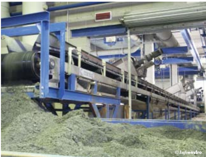
Cinta transportadora descargando en contenedor

tualmente desde la propia zona, dirigir los residuos extraídos a las prensas y contenedores que estén en situación de disponibilidad.