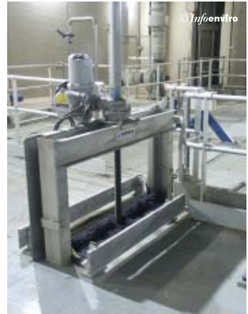
Compuerta automática de los canales de reparto y bypass de los decantadores

Comprende 10 decantadores lamelares de geometría cuadrada, de solera inclinada y circular, con mecanismo de rasquetas concentradoras de fangos de accionamiento central. Las lamelas son pla-