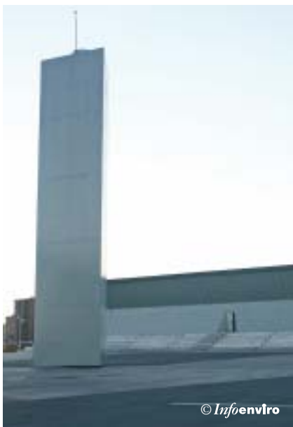
Toma de aire y chimenea de desodorización integrada en la Plaza del Fórum

Las aguas procedentes del desbaste y desarenado son conducidas al tratamiento primario mediante dos canales de 2,50 m de ancho y 2,40 m de altura en la zona de desarenado. A partir de la confluencia de estos canales, se disponen uno por debajo del otro, con secciones en cajón de 2,50 m de ancho x 2,00 / 1,90 m de altura.