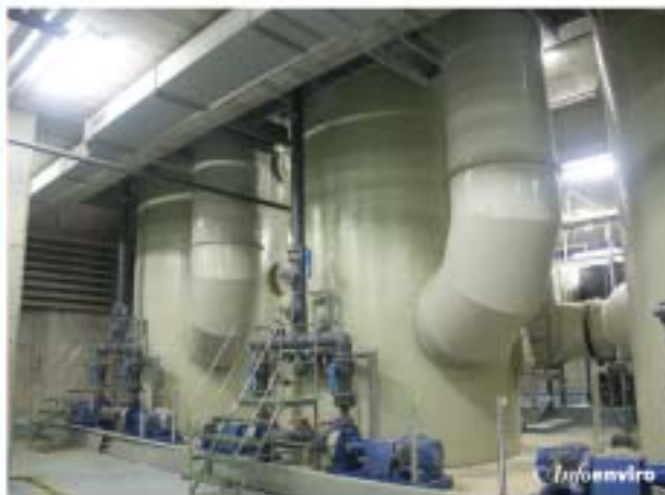
Torres de lavado de la desodorización en tratamiento primario

La climatización del aire empleada en el sistema de ventilación de la decantación primaria consiste esencialmente en el filtrado de impurezas y en su deshumidificación para evitar condensaciones en los recintos ventilados. Esta deshumidificación es un aspecto importante ya que evita las condensaciones en los edificios y recintos cerrados, las cuales, además de ser desfavorables para las condiciones ambientales en general, pueden ser causantes de severas corrosiones en equipos y de la reducción de la vida útil de las instalaciones.