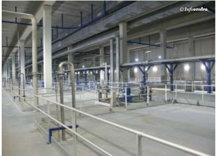
Sala de decantación y espesamiento (vista general)