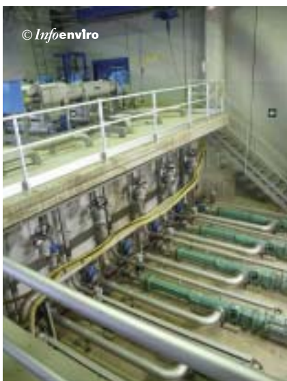
Bombas de impulsión de fangos a tamizado

La instalación se completa con dos polipastos y las correspondientes instalaciones eléctricas y de automatis-