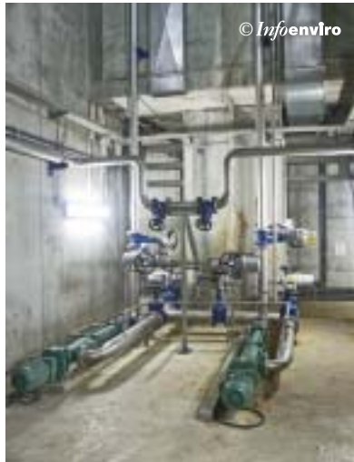
Bombas de extracción y recirculación de fangos primarios espesados

Se han interconectado las dos bombas de cada grupo mediante válvulas motorizadas, tanto en la aspiración como en la impulsión, de manera que cada bomba puede aspirar indistintamente de cada uno de los decantadores correspondientes dando por ello gran flexibilidad al sistema en caso de avería de una de las bombas.