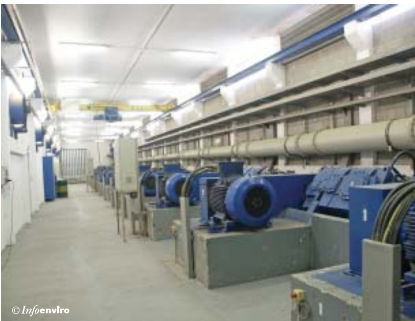
Sala de motores de los tornillos de elevación de agua bruta

Each set of four filtering channels is equipped with a conveyor belt that collects the waste from the four grates. Each is also equipped with a spiral conveyor that removes the sludge deposited by the four