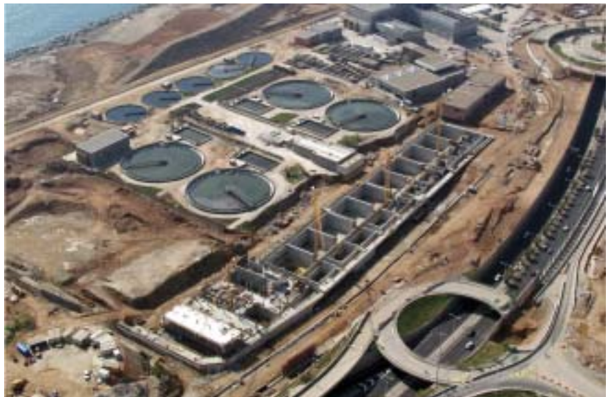
Obras 1ª fase. En primer término el nuevo tratamiento primario en ejecución