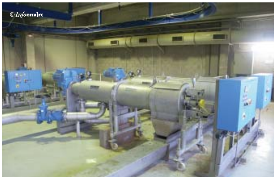
Equipos de tamizado de los fangos primarios

Given the location of the sewage works, in the midst of a highly populated urban area, limiting the possible impact of odours has been considered essential. For that purpose the concept of "zero non-deodorised emissions" has been adhered to. This principle means that all the areas from which odours could be emitted must be contained inside closed structures and all the air that enters into those spaces for ventilation or processing must be deodorised before being released into the atmosphere. Once treated, this air is emitted through a stack of the necessary height and other specifications to meet the desired dispersion requirements. The concept also requires that the buildings be located slightly below ground level.