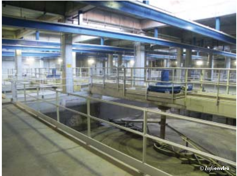
Desarenador tipo "detrítus" y rasquetas de arrastre

Con el fin de reducir el espacio y las emisiones, las instalaciones de desarenado son no aireadas, de tipo "detrítus", de forma cuadrada de 10 m de lado y 1,5 m de altura útil y están compuestas por dos conjuntos de tres unidades. Cada conjunto