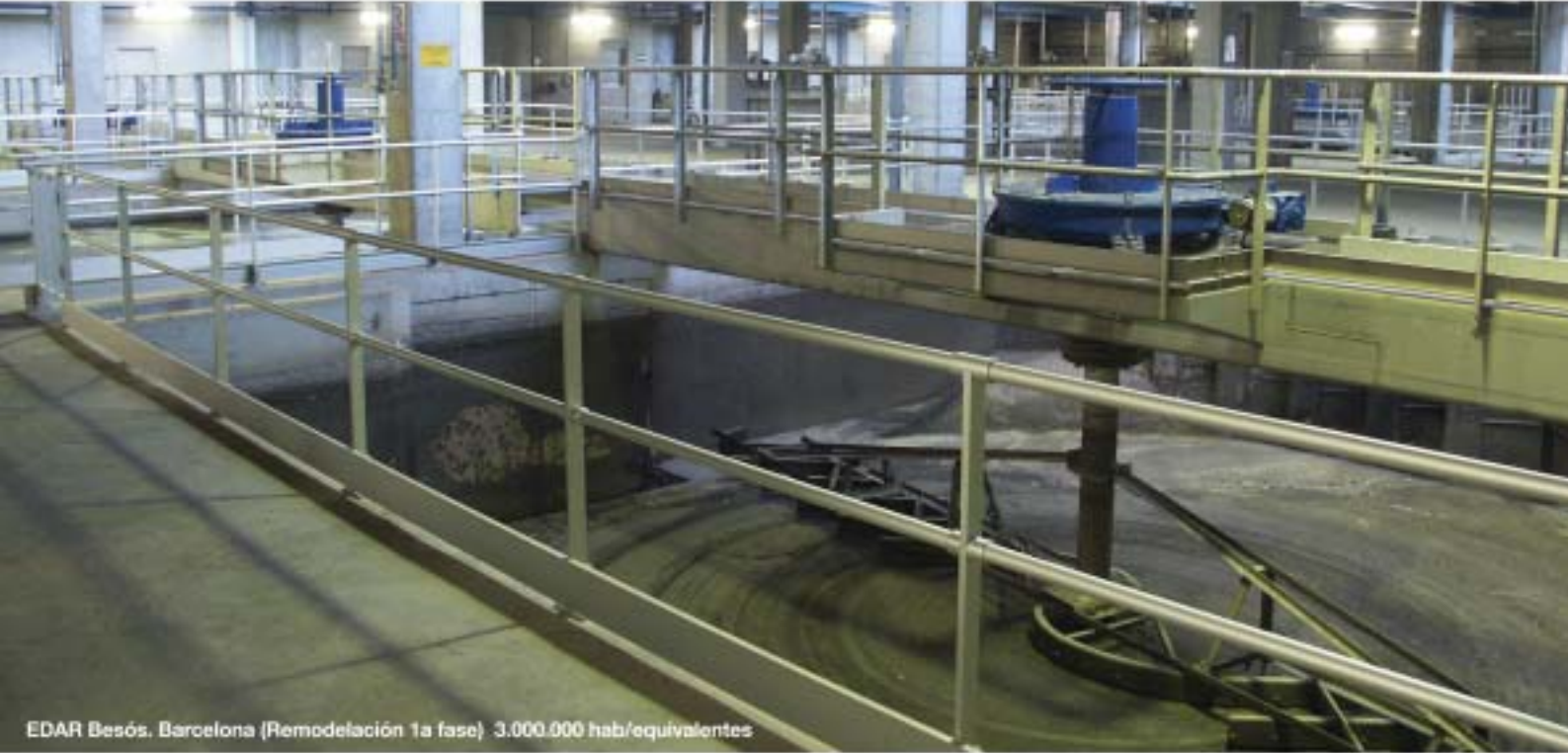
EDAR Besós, Barcelona (Remodelación 1a fase) 3.000.000 hab/equivalentes

Experiencia y calidad en la gestión del agua