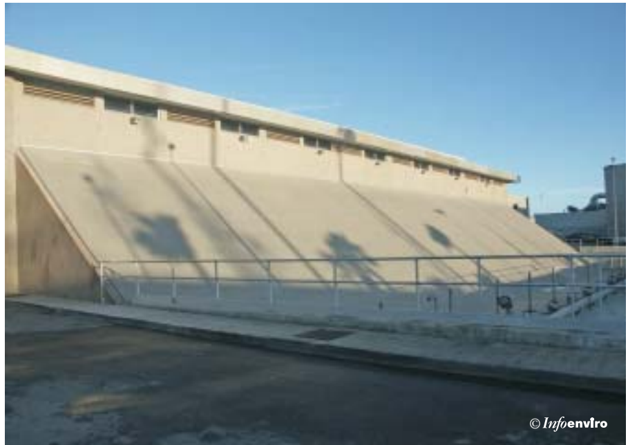
Cubierta de los tornillos de Arquímedes