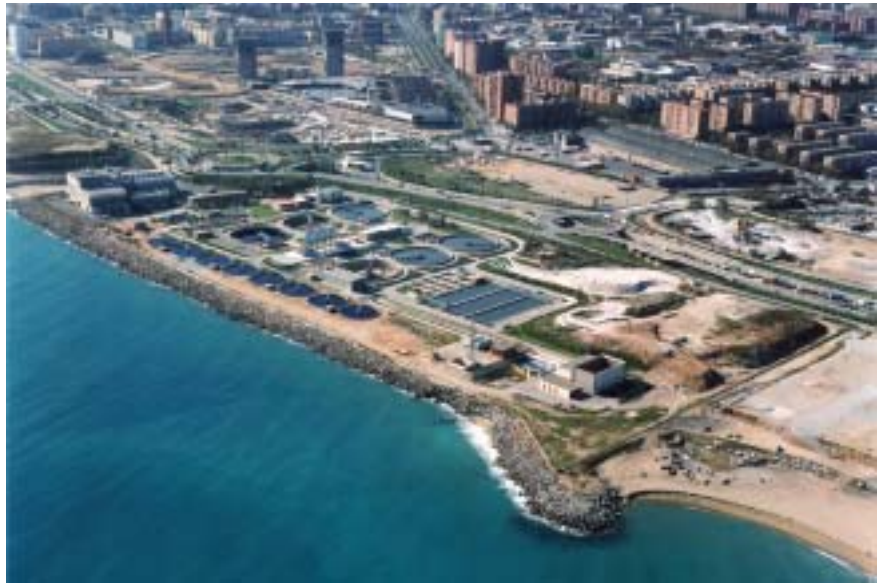
Antigua depuradora Besós

Con el funcionamiento de la nueva depuradora se logrará disponer de unas aguas costeras más limpias, una ciudad más sostenible y unas playas de más calidad en todo el litoral norte de Área Metropolitana.