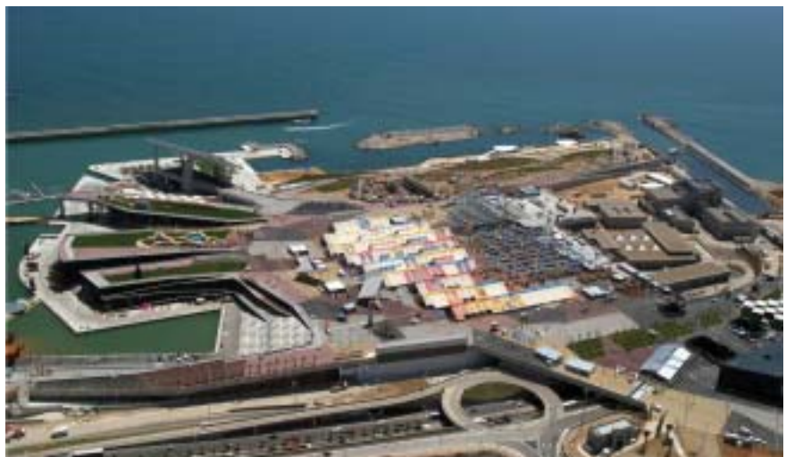
Explanada sobre la nueva depuradora durante la celebración del Forum