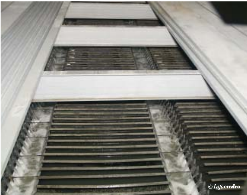
Lamelas de la decantación primaria

Se ha construido también un by-pass controlado del tratamiento biológico para un caudal de 14.375 m 3 /h. Con esta finalidad se ha incorporado una válvula de mariposa reguladora y un medidor magnético de caudal en la tubería que conecta el canal de agua con el canal de by-pass general.