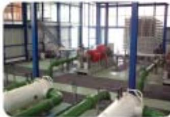
IDAM, Alicante, 50.000 m 3 /día