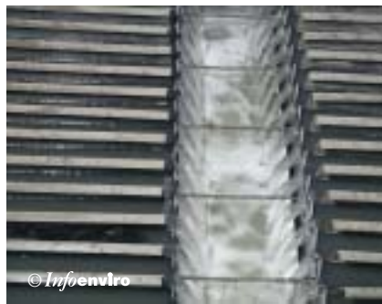
Canales de recogida del agua decantada en el sistema lamelar

Cada uno de los decantadores al objeto de conocer el caudal de agua así como el nivel de fangos, dispone de la correspondiente instrumentación y medidores de nivel.