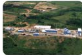
ETAP, Fajardo, Puerto Rico, 48.000 m 3 /día

Empresa pionera en el mercado español del agua, INFILCO ESPAÑOLA, S.A. opera en la actualidad como una de las empresas líderes del sector, apostando por la innovación y la aplicación de las tecnologías más avanzadas, así como por el mantenimiento de la calidad que siempre le ha caracterizado en las distintas áreas de actividad: diseño, ingeniería, construcción y operación y mantenimiento de instalaciones.