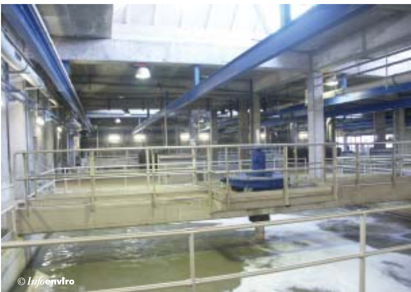
Sala de desarenado

The water treated in each unit is collected in a gutter that extends along the full width of the unit. The waste water is dumped from the gutters into a channel common to three desilters. Subsequently, it is carried to the primary treatment plant, via two interconnecting channels.