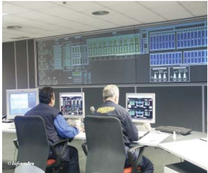
Sala de control

mo y control. Dispone de un sistema de eliminación de olores mediante carbón activo, que se integrará más tarde en el de las nuevas instalaciones, en construcción, de espesado de fangos biológicos.