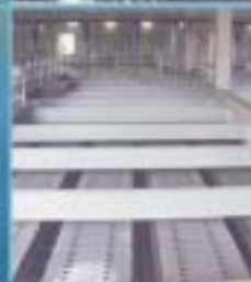
EDAR Baix Llobregat