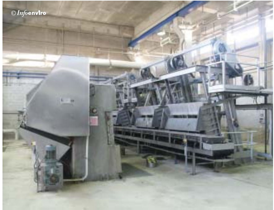
Rejas y tamices de desbaste

El automatismo de arranque y paro de rejillas, tamices, tornillos y cintas transportadoras y prensas, está sincronizado automáticamente por el sistema de control central. Existe un panel local de control y maniobra que permite pun-